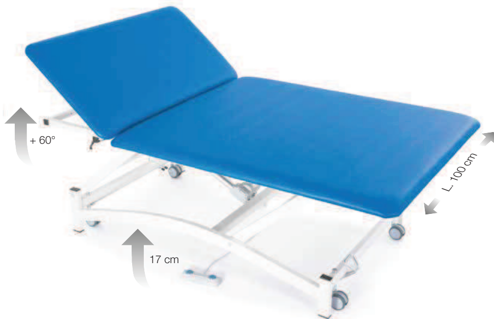
Modello rappresentato cod. 113021 + Optional cod. 123010 Model shown code 113021 + Accessories code 123010