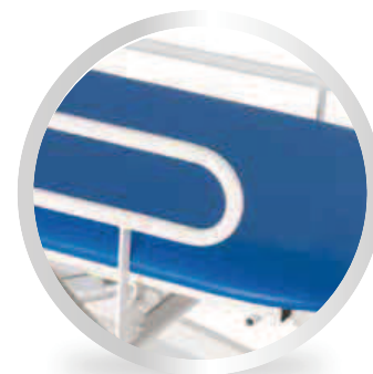
Sponde laterali ribaltabili / Collapsible lateral sides Cod. 120030