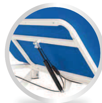
Regolazione testata con pistone a gas Adjustable backrest section by gas piston