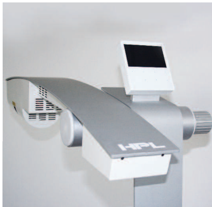
Rotazione del piano di scansione