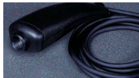
Manipolo per trattamenti manuali e puntiformi

nei materiali, con l'utilizzo di una buona percentuale di lega di alluminio al posto del ferro per conferire leggerezza e altri componenti ecocompatibili. Nuovo nelle soluzioni di trasferimento di energia sul paziente con ottiche ancora più performanti ed efficaci. Nuovo, infine, nel software per offrire un accesso più semplice e attuale, ispirato ai prodotti in tecnologia "consumer".