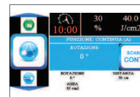
Trattamento a scansione in corso.