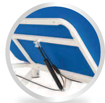
Regolazione testata con pistone a gas Adjustable backrest section by gas piston